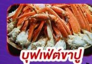
บุฟเฟ่ต์งาปู