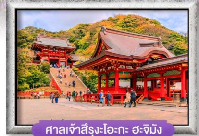
ศาลเจ้าฟูชิมิอินาริ ฟูจิ

พิเศษ! บุฟเฟ่ต์ซาปู, แช่น้ำแร่ออนเซ็น 5 วัน 3 คืน เดินทาง ก.ค. - ส.ค. 66 อาหาร : 6 มื้อ