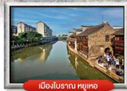
เมืองโบราณ หยูเทอ