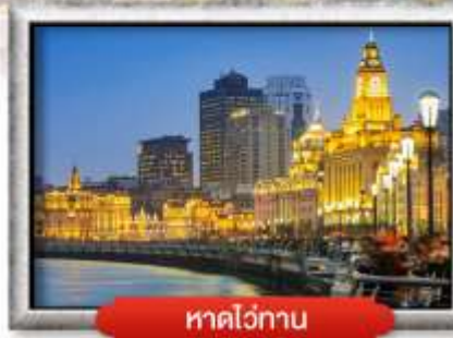
หาดไถ่กาน