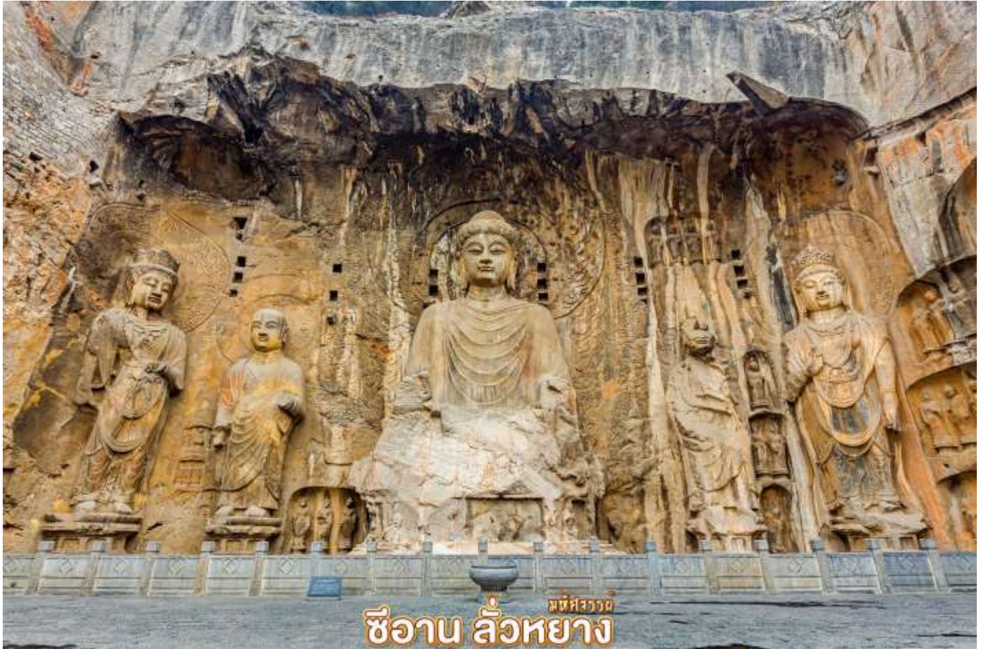
มณฑลเหอหนาน ซีอาน ลั่วหยาง